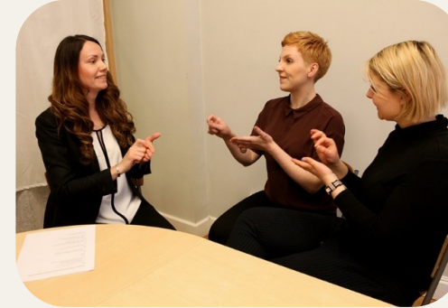
Tolkutbildning inom folkbildningen