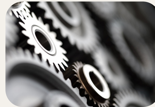
Myndighetsamverkan för kompetensförsörjning och livslångt lärande