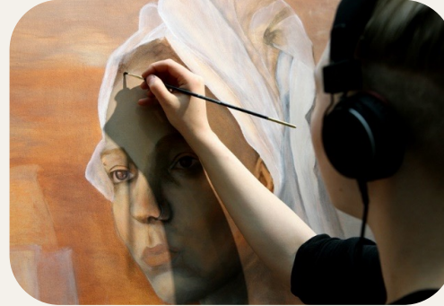
Konst- och kulturutbildningar